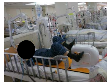
血液透析中の運動例