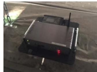
チップスケール原子時計搭載 IoT センサ