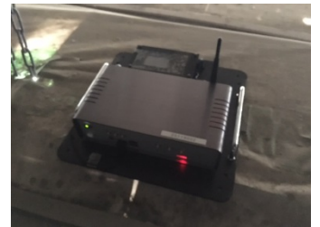
チップスケール原子時計搭載 IoT センサ